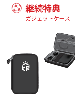
🏆 継続特典 ガジェットケース