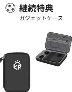
🏆 継続特典 ガジェットケース