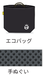
エコバッグ 手ぬぐい