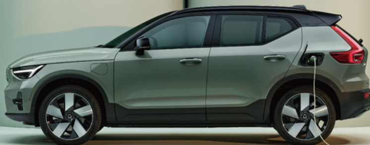
XC40 Recharge Ultimate Twin Motor

北欧の革新性が生み出したコンパクト・シティ SUV。 ボルボ XC40 に、ピュア EV モデルがラインナップ されました。