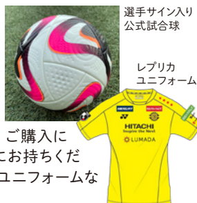
選手サイン入り 公式試合球

[2] ローソン特設ブース売店出 店からあげクンやポークフランクな ど、ローソンおなじみメニューを 販売!